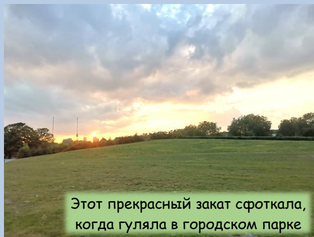
Этот прекрасный закат сфотокала, когда гуляла в городском парке