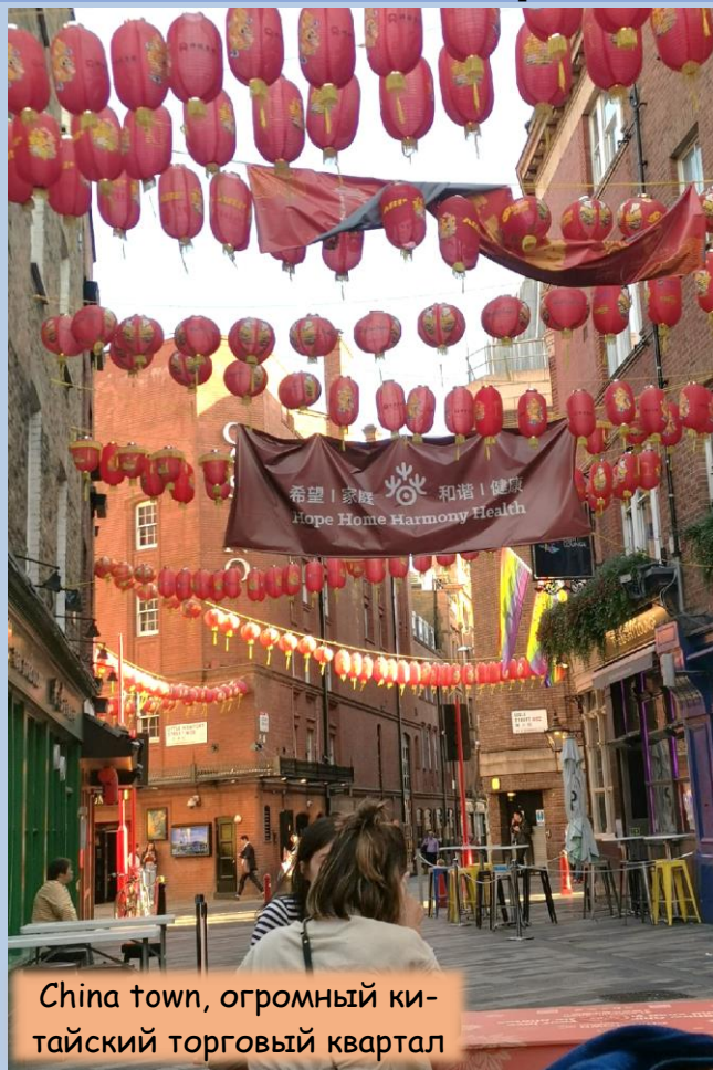
China town, огромный китайский торговый квартал

член редколлегии независимой открытой газеты «А» в КРУГЕ»